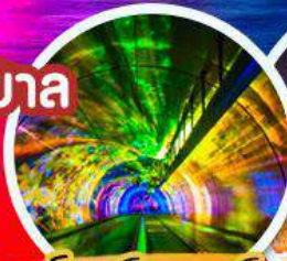
จูมิงค์เคเซอร์