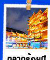
ตลาดร้อยปี